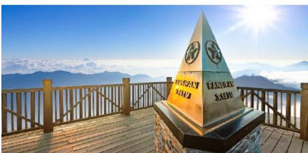
ยอดเขาฟานซีปัน