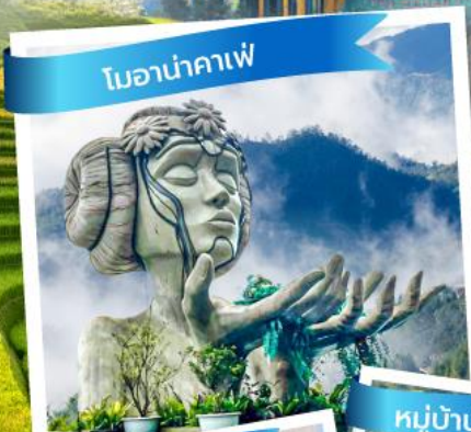
โมอานาคาเฟ่