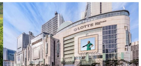
Lotte Center Hanoi

*ทางบริษัทฯ ขอสงวนสิทธิ์ในการสลับโปรแกรมทัวร์ตามความเหมาะสมขึ้นอยู่กับสถานการณ์หน้างาน โดยคำนึงถึงผลประโยชน์ของลูกค้าเป็นสำคัญ