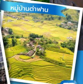
หมู่บ้านต้าฟาน