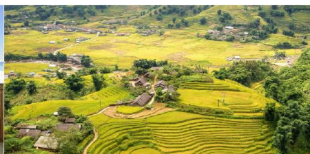
หมู่บ้านต้าฟาน