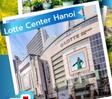
Lotte Center Hanoi